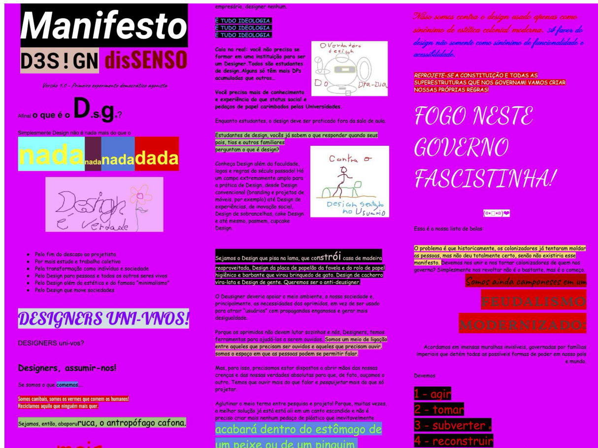
Figura 2 – Manifesto Design Dissenso.

também política. A irregularidade visual procurava expressar a experiência de instabilidade e conflito que caracterizava o contexto político brasileiro naquele período. Uma das estudantes que participou da elaboração do manifesto, em uma reflexão posterior, identificou a monstrosidade como uma característica marcante dessa estética (ANGELON & VAN AMSTEL, 2021).