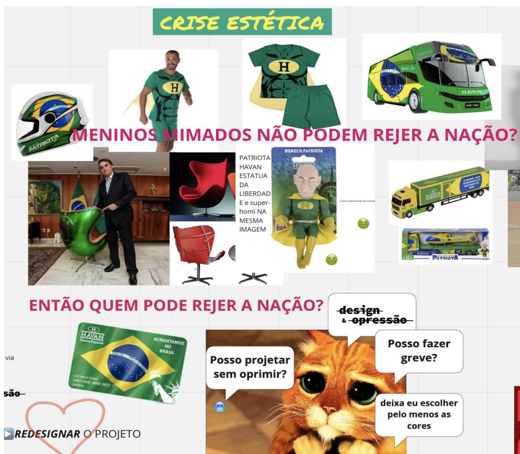
Figura 1 – Fragmento de análise colaborativa de designs bolsonaristas realizadas em aplicativo de quadro branco.